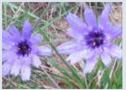
La catananche bleue