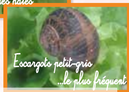
Escargot petit-gris ...le plus fréquent

Les escargots sont hermaphrodites. Lors de l'accouplement, il y a fécondation croisée. Les œufs sont pondus dans le sol. L'un comme l'autre hibernent en s'enfonçant dans le sol après avoir fermé la coquille par une cloison de mucus qui se solidifie, l'épiphragme.