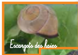
Escargot des haies