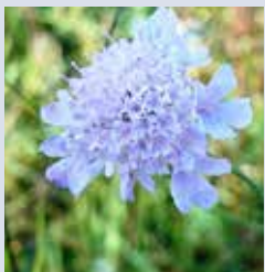
Knautie des champs