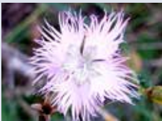
L'oeillet de Montpellier