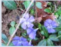
La petite pervenche