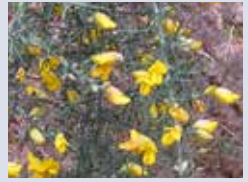
Le genêt scorpion