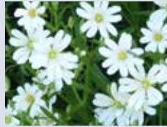
La stellaire holostée