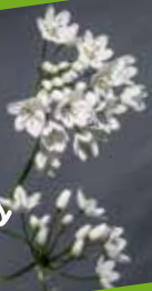
L'ail de Naples

C'est une plante moyenne de 20 à 50cm, sa tige est triangulaire, elle possède des ombelles à fleurs blanches. Il fleurit au début du printemps. Nous la trouvons dans les régions méditerranéennes : en plaine, au bord des sentiers, dans les champs. Cet ail est cultivé pour la décoration, ses feuilles comestibles ont une saveur douce.